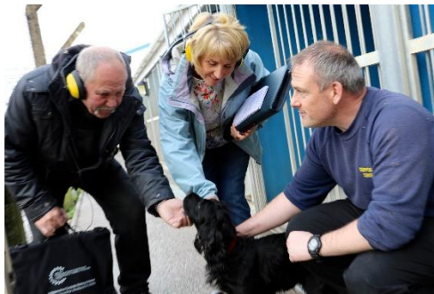
Delwedd o Gi yr Heddlu gydag Ymwelwyr Lles Anifeiliaid ar Safle Waterton

Mae'r ymwelwyr hefyd yn monitro unrhyw gŵn mewn cytiau sy'n aros am gartrefi newydd, mewn achosion lle y cânt eu gwrthod fel cŵn yr heddlu o bosibl, neu pan fydd eu swyddogion yn ymddeol. Mae ymwelwyr yn nodi unrhyw salwch, anafiadau ac yn cadw llygad am unrhyw arwyddion o straen. Nodir glanweithdra'r cytiau cŵn, y stablau a'r safle hefyd.