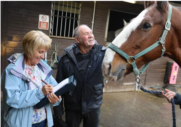
Delwedd o Geffyl yr Heddlu gydag Ymwelwyr Lles Anifeiliaid ar Safle Waterton

Caiff Cynllun Lles Anifeiliaid De Cymru ei hwyluso gan saith gwirfoddolwr ar hyn o bryd (gan gynnwys pedwar recriwt newydd a fydd yn dechrau ym mis Mehefin 2023), sydd hefyd yn Ymwelwyr Annibynnol â Dalfeydd. Mae'r gwirfoddolwyr yn cynnal ymweliadau dirybudd rheolaidd ag Adran Cŵn a Cheffylau Heddlu De Cymru i arsylwi ac adrodd ar drefniadau lles, stablau ceffylau a chytiau cŵn yr heddlu.