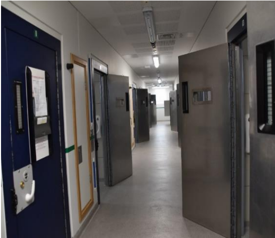
Delwedd o Ddalfa Merthyr

Mae Heddlu De Cymru yn gweithredu pedair dalffa, ac mae'r rhain wedi'u lleoli ym Mae Caerdydd, Merthyr Tudful, Abertawe a Phen-y-bont ar Ogwr. Adeiladwyd y dalfeydd ym Merthyr a Phen-y-bont ar Ogwr yn 2014 ac maent wedi'u lleoli i fwrdd o ganol y dref. Mae gan bob dalffa 42 o gelloedd ac mae'r ddwy ddalffa yn unfath o ran cynllun. Mae'r ddalffa hynaf yn ardal De Cymru yn Abertawe. Mae'n rhan o orsaf heddlu Canol Abertawe, gyda 27 o gelloedd. Cwblhawyd gorsaf heddlu Bae Caerdydd yn 2009 ac mae'r ddalffa wedi'i chynllunio dros 2 lefel, gyda chyfanswm o 60 o gelloedd.